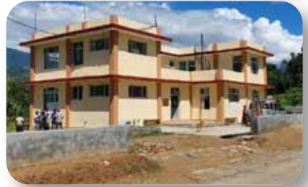
Outreach Klinik Phalebas