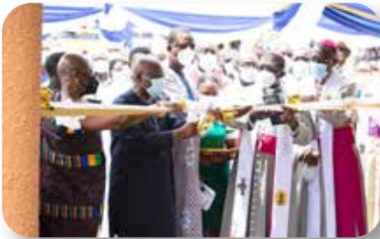
Der lokale Chief, der Gesundheitsminister Ghanas, der Präsident des Rotary Clubs Kumasi – East und der Bischof von Accra und der Bischof von Kumasi der Methodistischen Kirche bei der Eröffnungszeremonie.